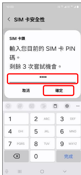
8.輸入您目前的 SIM 卡 PIN 碼→確定