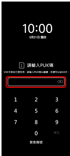
1. PIN 碼 3 次錯誤 顯示輸入 PUK 碼