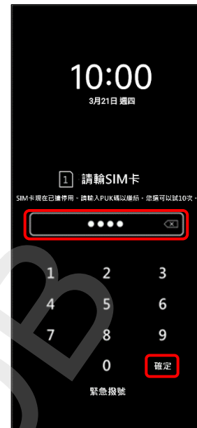
3. 輸入新 PIN 碼 → 確定