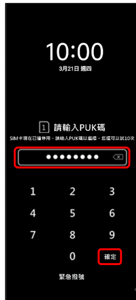
2. 輸入 8 位數 PUK 碼 → 確定