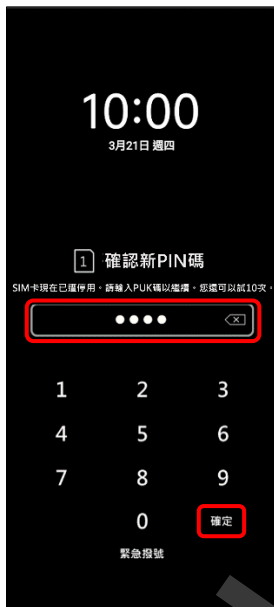
4. 確認新 PIN 碼 → 確定