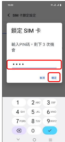
6.輸入 PIN 碼→確定