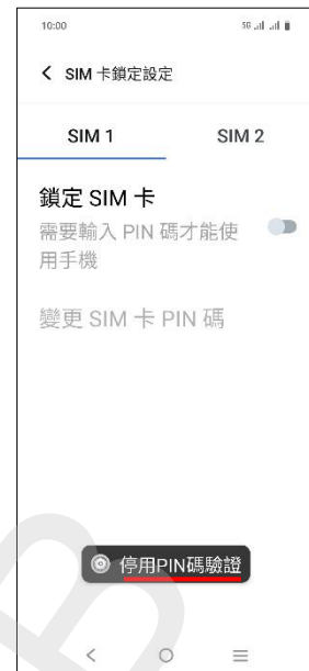
7. 完成 (停用 PIN 碼驗證)