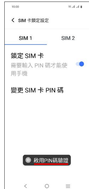
7.完成 (啟用 PIN 碼驗證)