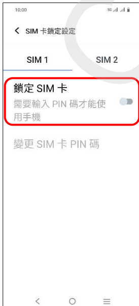
5.鎖定 SIM 卡→開啟