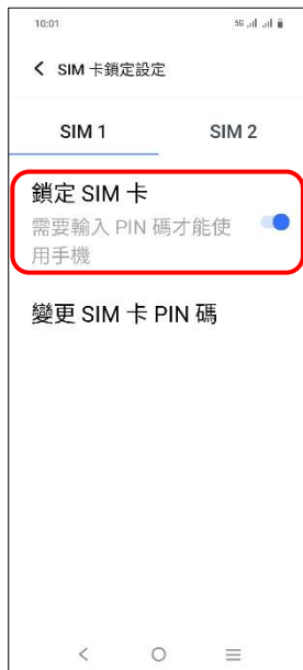
5. 鎖定 SIM 卡 → 關閉