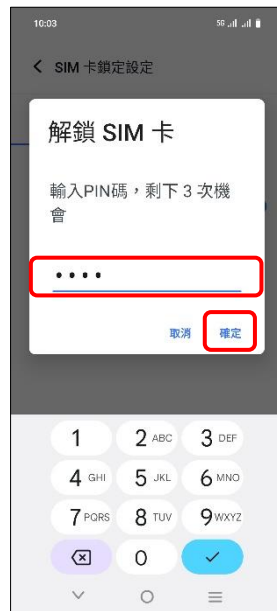
6. 輸入 PIN 碼 → 確定