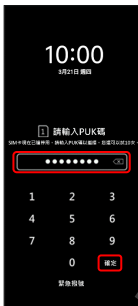
2. 輸入 8 位數 PUK 碼 → 確定