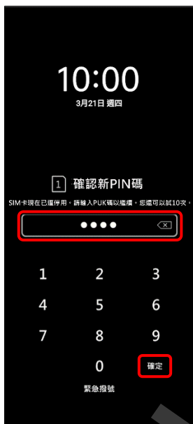
4. 確認新 PIN 碼 → 確定