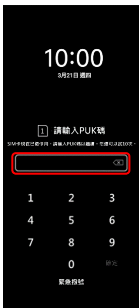
1. PIN 碼 3 次錯誤 顯示輸入 PUK 碼