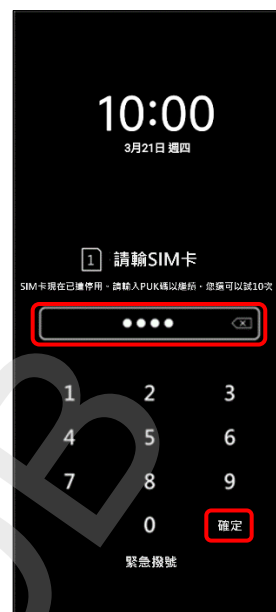
3. 輸入新 PIN 碼 → 確定