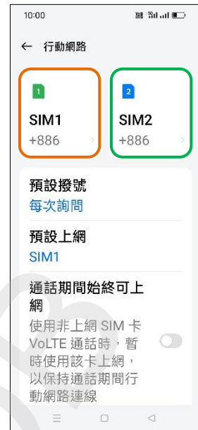
3. 選擇 SIM1/SIM2