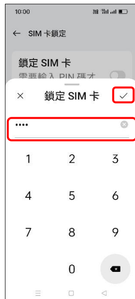
7. 輸入 SIM 卡 PIN 碼 → ✓ (確定)