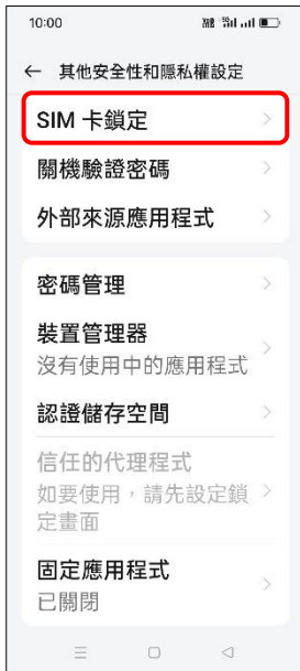
4. SIM 卡鎖定