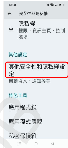
3. 其他安全性和 隱私權設定