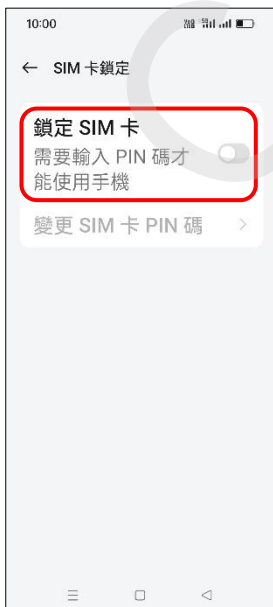
6. 鎖定 SIM 卡 → 開啟