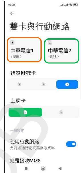
3. 選擇 SIM1/SIM2