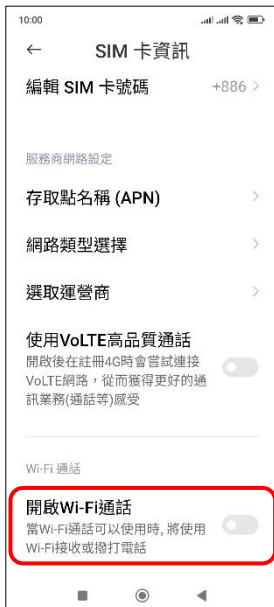
4. 開啟 Wi-Fi 通話 → 開啟