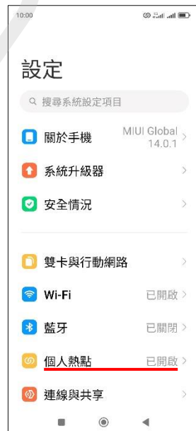
6.完成首次個人熱點開啟