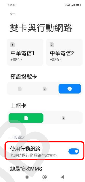
3.使用行動網路→關閉