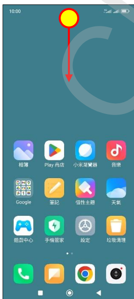
方式二： 1.通知列往下拉