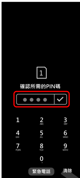
4. 確認所需的 PIN 碼 → ✓