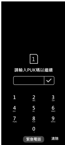
1. 輸入 PIN 碼 3 次錯誤 顯示輸入 PUK 碼