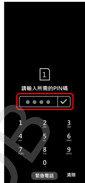
3. 輸入所需的 PIN 碼 → ✓