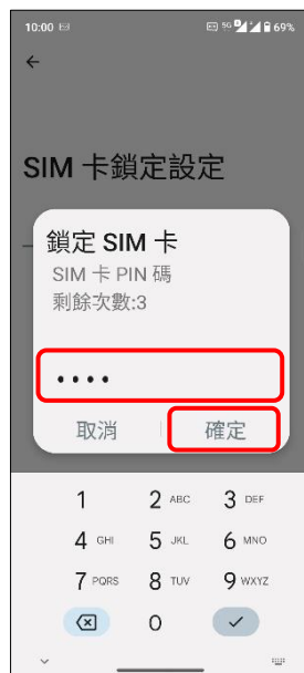
6.輸入 SIM 卡 PIN 碼 →確定