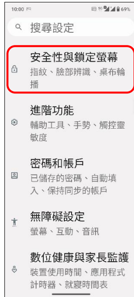
2.安全性與鎖定螢幕