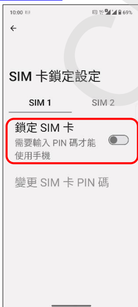
5.鎖定 SIM 卡→開啟