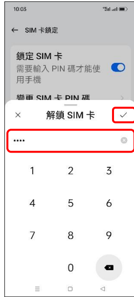
7. 輸入 SIM 卡 PIN 碼 → ✓ (確定)