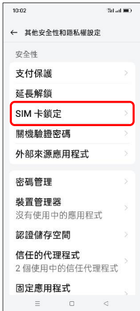
4. SIM 卡鎖定