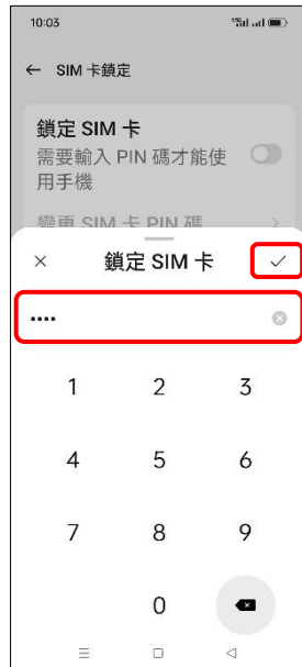
7. 輸入 SIM 卡 PIN 碼 → ✓ (確定)