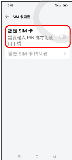
6. 鎖定 SIM 卡 → 開啟