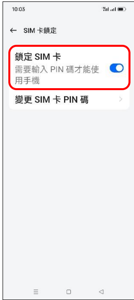
6. 鎖定 SIM 卡 → 關閉