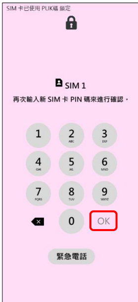
4. 再次輸入新 SIM 卡 PIN 碼 →OK