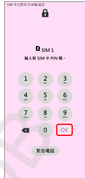
3. 輸入新 SIM 卡 PIN 碼 →OK