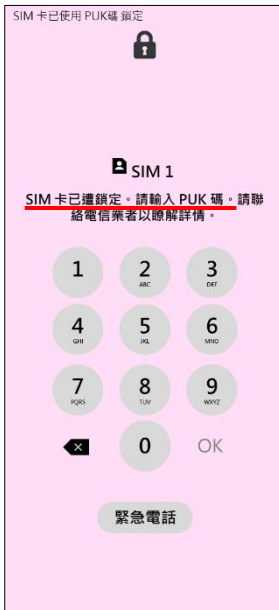
1. 輸入 PIN 碼 3 次錯誤 顯示輸入 PUK 碼