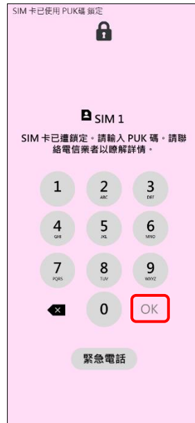
2. 請輸入 8 位數 PUK 碼 →OK