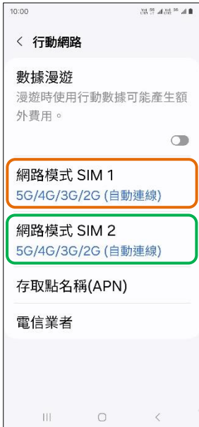
4.網路模式 SIM1/SIM2 (例: SIM1)