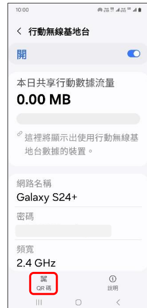
6.輕觸 QR 碼