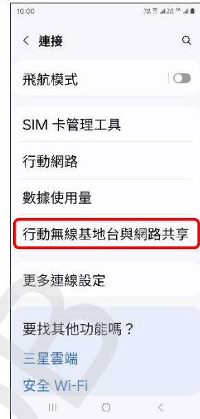
3.行動無線基地台與網路共享