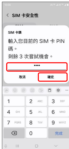
8.輸入您目前的 SIM 卡 PIN 碼→確定