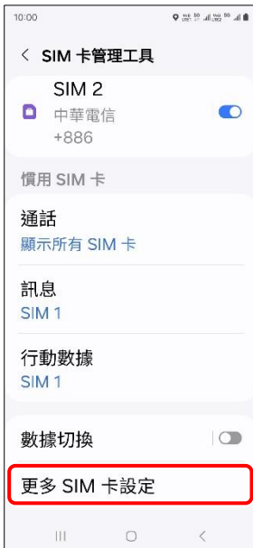
4.更多 SIM 卡設定