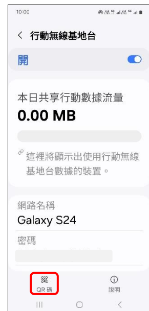
6.輕觸 QR 碼