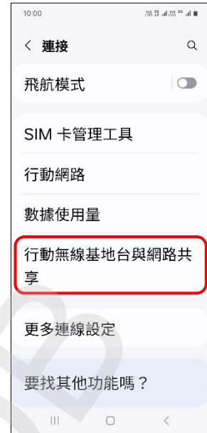
3.行動無線基地台與網路共享