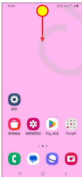
方式二： 1.從螢幕頂端往下滑以開啟快捷列