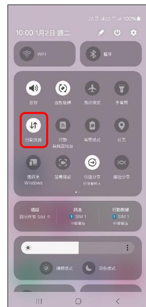
3.點 ⏴ → 行動數據 關