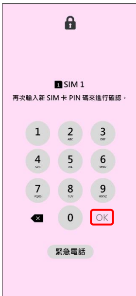
4. 再次輸入新 SIM 卡 PIN 碼 → OK