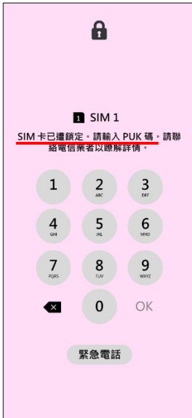
1. 輸入 PIN 碼 3 次錯誤 顯示輸入 PUK 碼