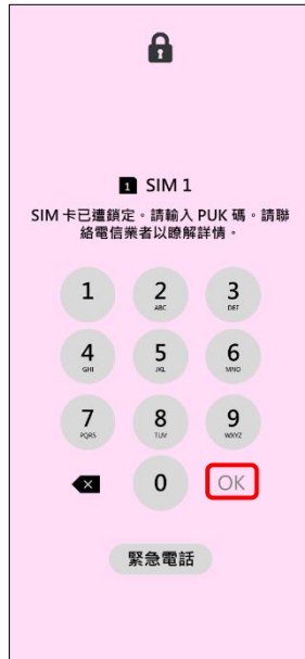
2. 請輸入 8 位數 PUK 碼 →OK