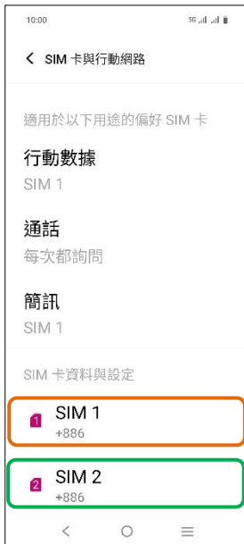
4. 選擇 SIM1/SIM2