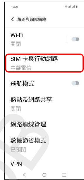
3. SIM 卡與行動網路