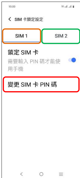
4.選擇 SIM1/SIM2 →變更 SIM 卡 PIN 碼