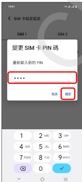
7.重新輸入新的 PIN →確定