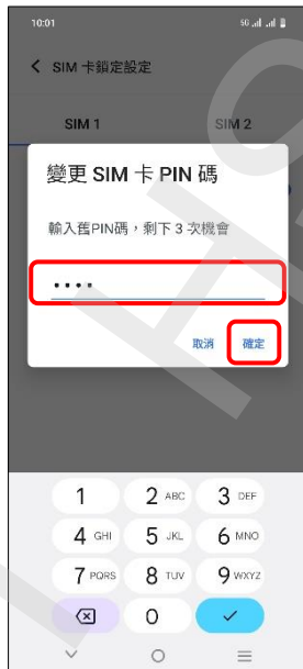
5.輸入舊 PIN 碼→確定