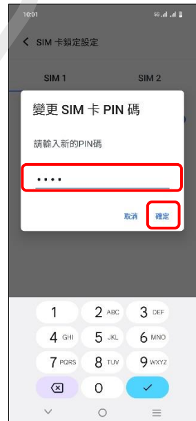
6.輸入新的 PIN 碼 →確定