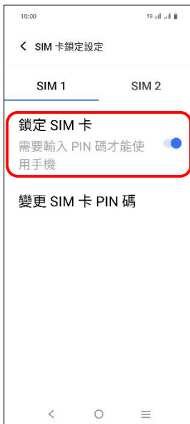
5. 鎖定 SIM 卡 → 關閉