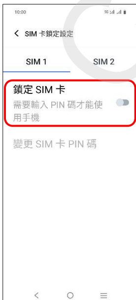
5.鎖定 SIM 卡→開啟