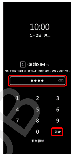
3. 輸入新 PIN 碼 → 確定