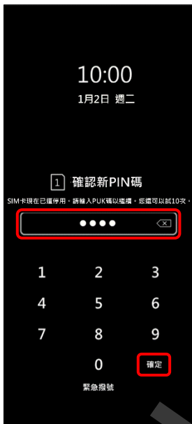
4. 確認新 PIN 碼 → 確定