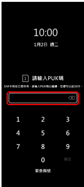
1. PIN 碼 3 次錯誤 顯示輸入 PUK 碼