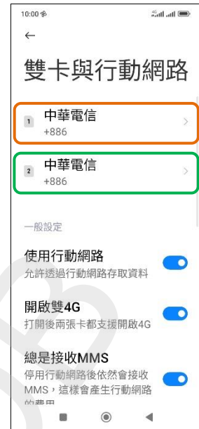
3. 選擇 SIM1/SIM2