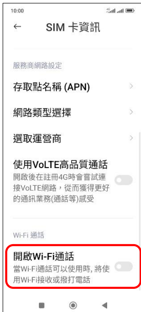
4. 開啟 Wi-Fi 通話 → 開啟