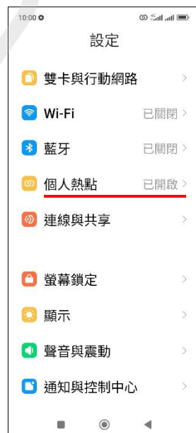
6.完成首次個人熱點開啟