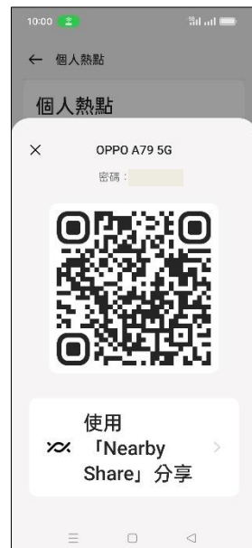
6.掃描 QR 圖碼即可連線