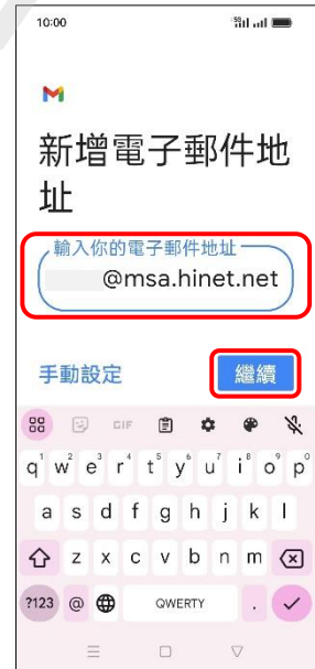
6.新增電子郵件地址 →繼續