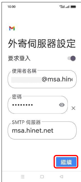
10.外寄伺服器設定 →繼續