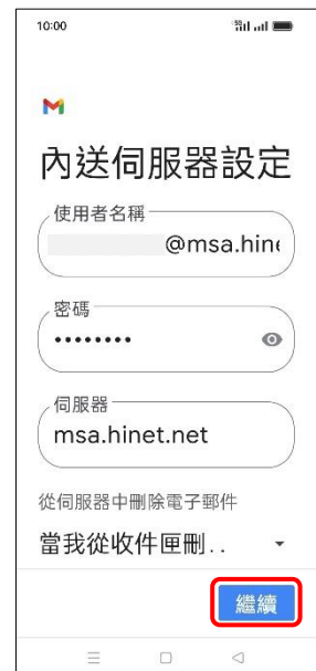
9.內送伺服器設定 →繼續