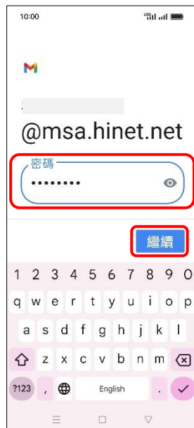
8.輸入郵件密碼→繼續