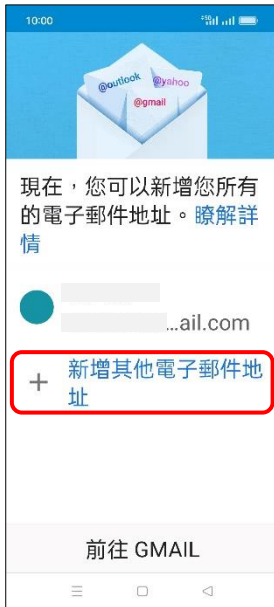
4. +新增其他電子郵件地址