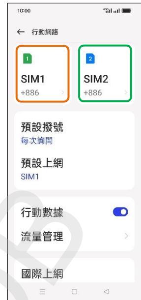
3. 選擇 SIM1/SIM2