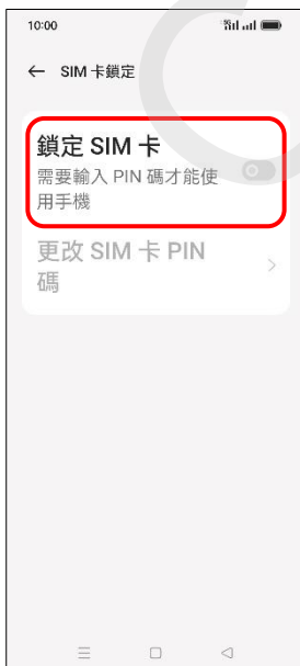
6.鎖定 SIM 卡→開啟