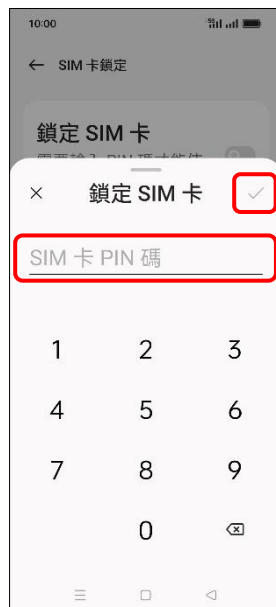
7.輸入 SIM 卡 PIN 碼 →✓