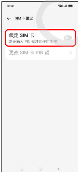
6. 鎖定 SIM 卡 → 開啟