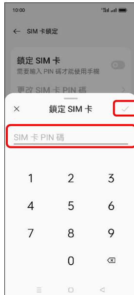
7. 輸入 SIM 卡 PIN 碼 → ✓ (確定)