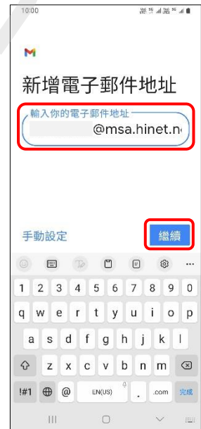
6.新增電子郵件地址 →繼續