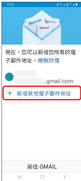
4. +新增其他電子郵件地址