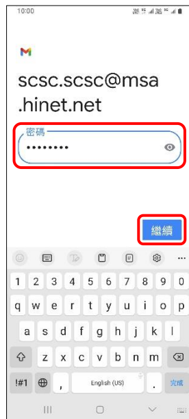
8.輸入郵件密碼→繼續