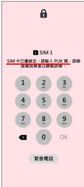
1. 輸入 PIN 碼 3 次錯誤 顯示輸入 PUK 碼