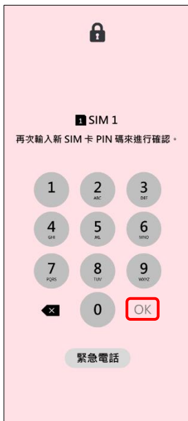
4. 再次輸入新 SIM 卡 PIN 碼 → OK