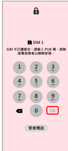
2. 請輸入 8 位數 PUK 碼 →OK