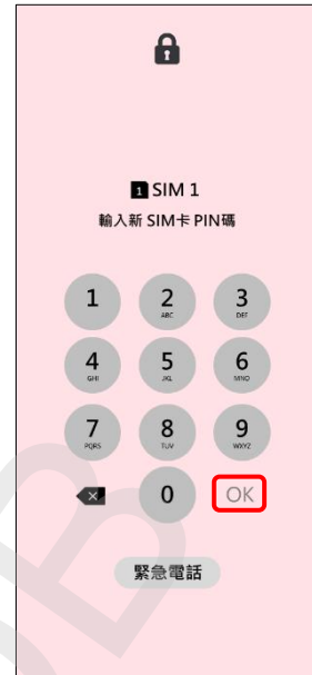
3. 輸入新 SIM 卡 PIN 碼 →OK