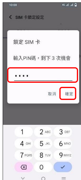
6.輸入 SIM 卡 PIN 碼 →確定