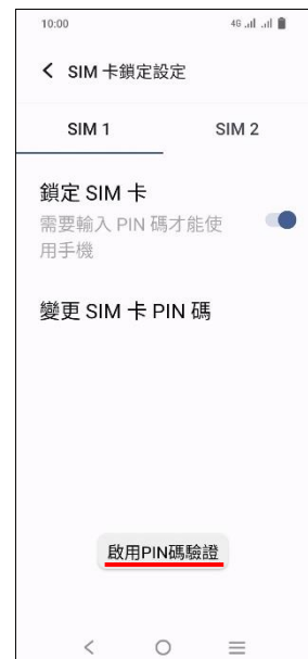
7.完成 (啟用 PIN 碼驗證)