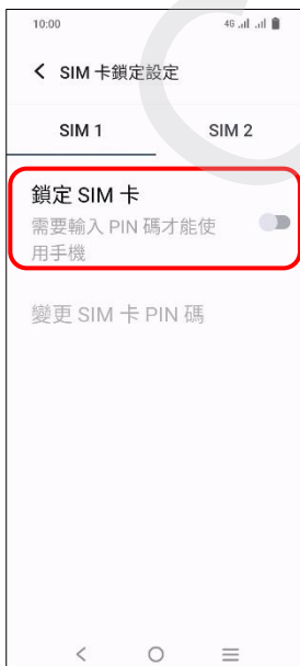
5.鎖定 SIM 卡→開啟