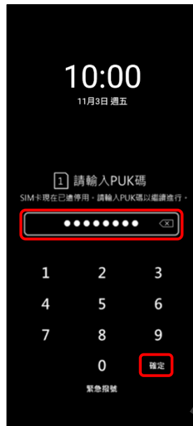
2. 輸入 8 位數 PUK 碼 → 確定