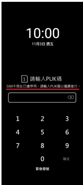
1. PIN 碼 3 次錯誤 顯示輸入 PUK 碼