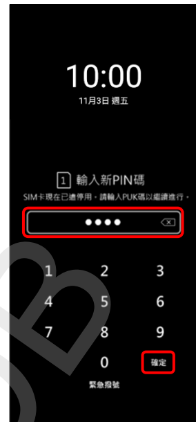
3. 輸入新 PIN 碼 → 確定