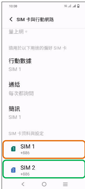
4. 選擇 SIM1/SIM2