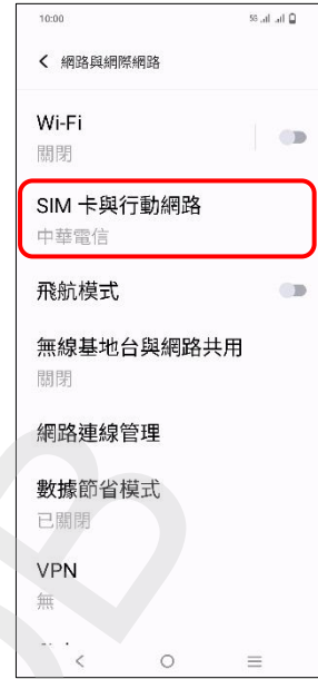
3. SIM 卡與行動網路