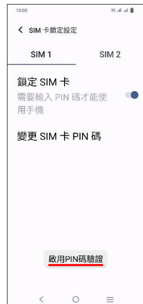
7.完成 (啟用 PIN 碼驗證)