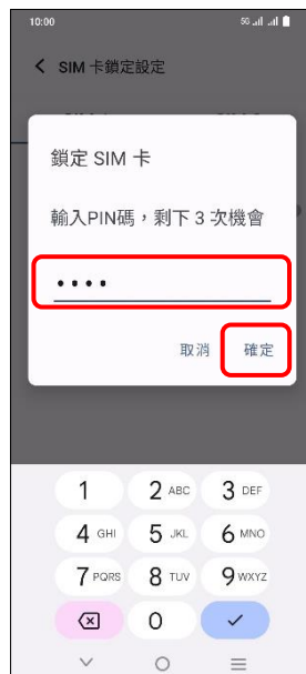
6.輸入 SIM 卡 PIN 碼 →確定