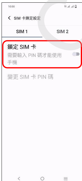
5.鎖定 SIM 卡→開啟