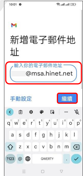
6.新增電子郵件地址 →繼續