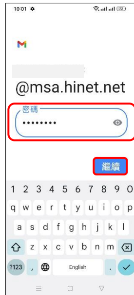
8.輸入郵件密碼→繼續