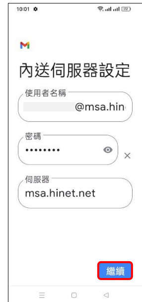
9.內送伺服器設定→繼續