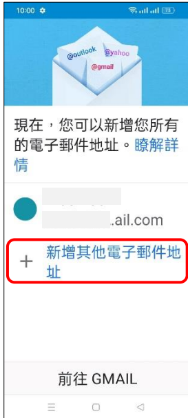
4. +新增其他電子郵件地址