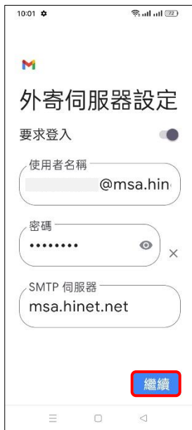
10.外寄伺服器設定→繼續