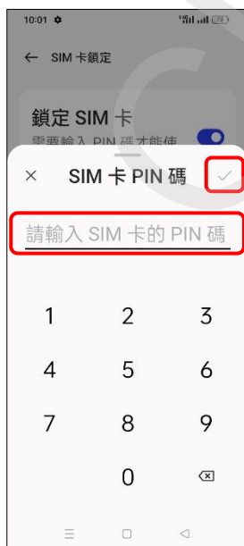
7. 輸入 SIM 卡的 PIN 碼 → ✓ (確定)