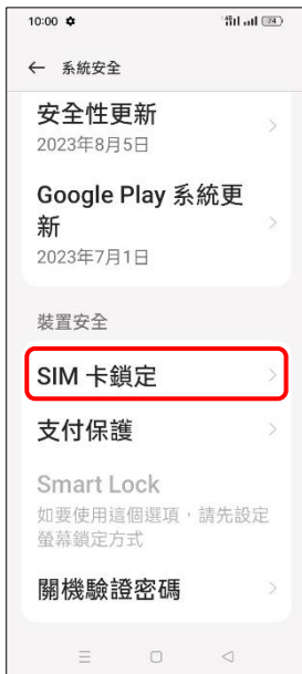
4. SIM 卡鎖定