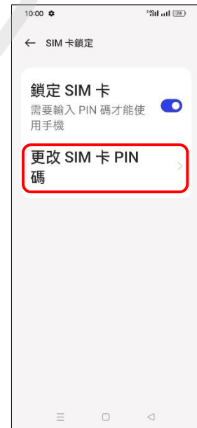
6. 更改 SIM 卡 PIN 碼