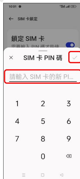
8. 輸入 SIM 卡的新 PIN 碼 → ✓ (確定)