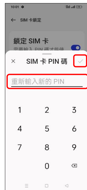
9. 重新輸入新的 PIN 碼 → ✓ (確定)