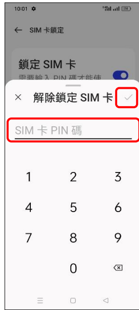
7. 輸入 SIM 卡 PIN 碼 → ✓ (密碼)