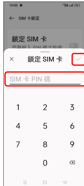
7.輸入 SIM 卡 PIN 碼 → ✓(密碼)