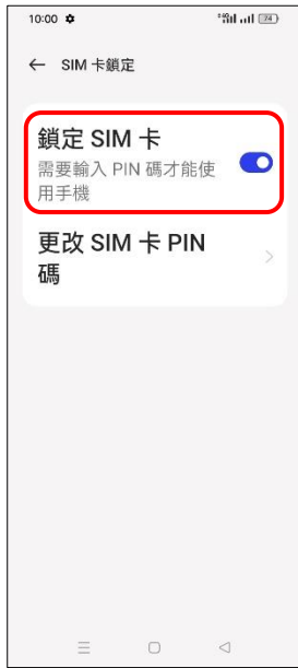
6. 鎖定 SIM 卡 → 關閉