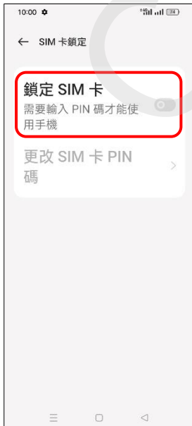
6.鎖定 SIM 卡→開啟