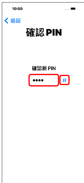
4. 確認新 PIN →好