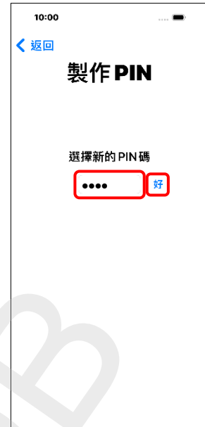
3. 選擇新的 PIN 碼 →好