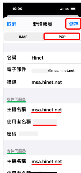
8. 輸入主機和使用者 名稱，選 POP → 儲存