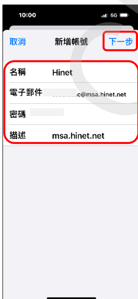
7. 輸入郵件帳號、密碼 → 下一步