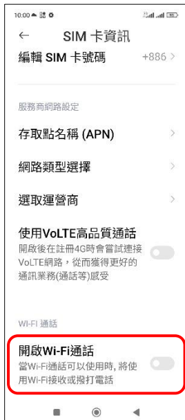
4.開啟 Wi-Fi 通話 →開啟