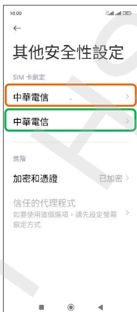
5. 選擇 SIM1/SIM2