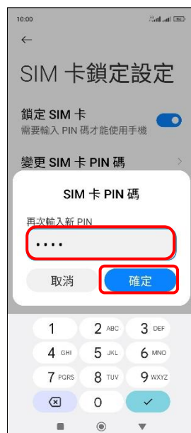
9. 再次輸入新 PIN → 確定