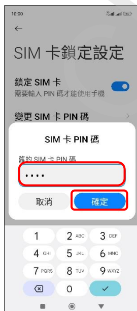
7. 舊的 SIM 卡 PIN 碼 → 確定