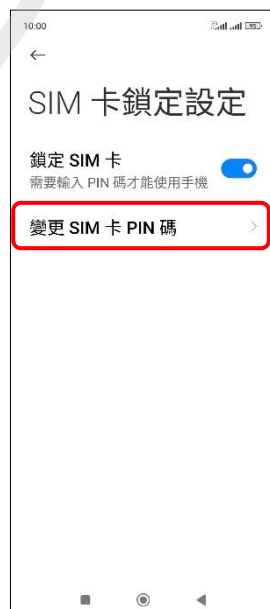
6. 變更 SIM 卡 PIN 碼