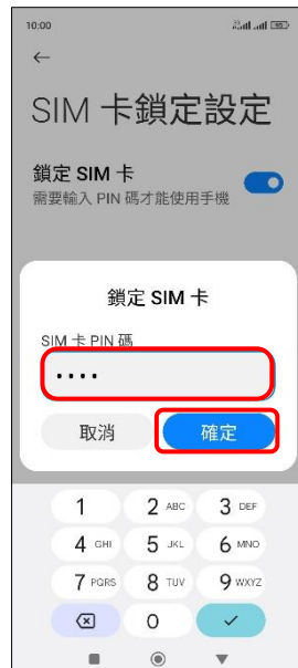
7.輸入 SIM 卡 PIN 碼 →確定