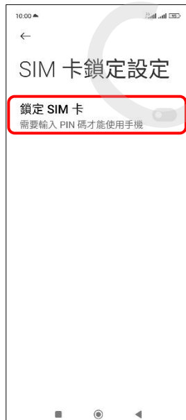
6.鎖定 SIM 卡→開啟