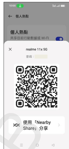
6.掃描 QR 碼連線此熱點