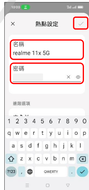
6.自行設定名稱與密碼 → ✓(儲存)