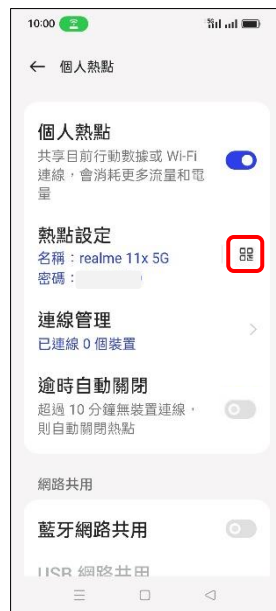
5.點選 QR 碼