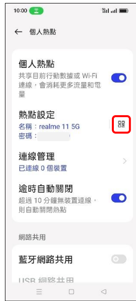
5.點選 QR 碼