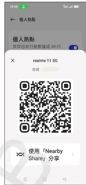
6.掃描 QR 碼連線此熱點