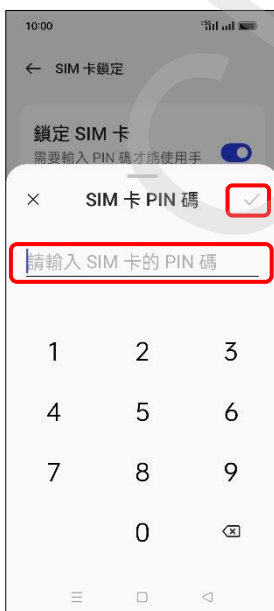
7. 輸入舊 PIN 碼 → ✓ (確定)