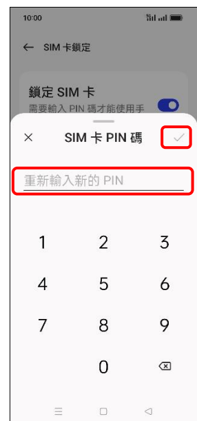
9. 重新輸入新 PIN 碼 → ✓ (確定)