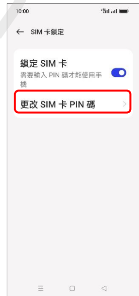
6. 更改 SIM 卡 PIN 碼