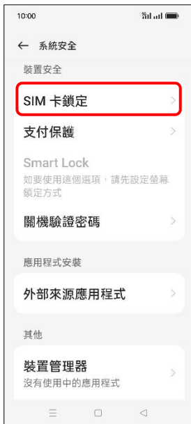
4. SIM 卡鎖定