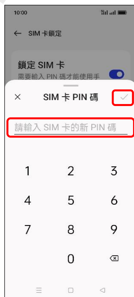
8. 輸入新 PIN 碼 → ✓ (確定)