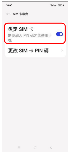
6. 鎖定 SIM 卡 → 關閉