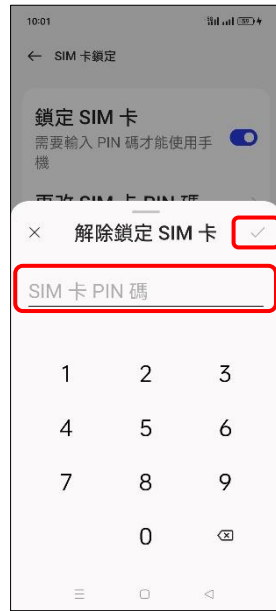
7. 輸入 SIM 卡 PIN 碼 → ✓