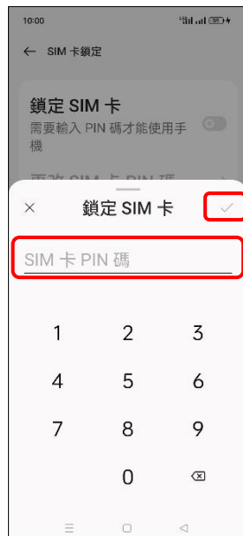
7.輸入 SIM 卡 PIN 碼 →✓