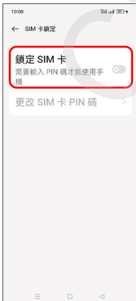
6.鎖定 SIM 卡→開啟