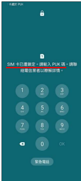
1.輸入 PIN 碼 3 次錯誤 顯示輸入 PUK 碼