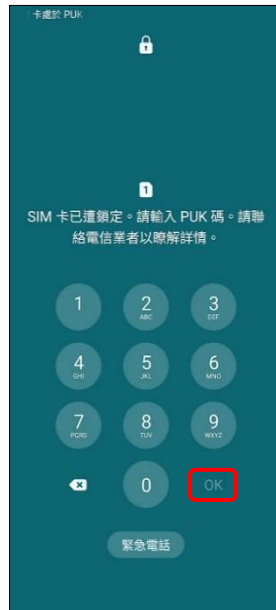
2.請輸入 8 位數 PUK 碼 →OK