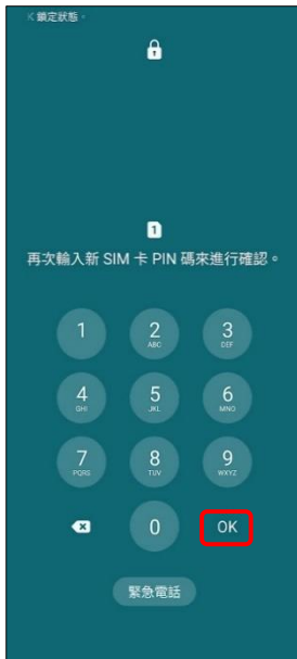
4.再次輸入新 SIM 卡 PIN 碼→OK