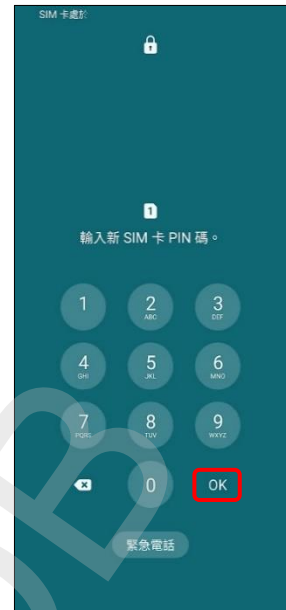
3.輸入新 SIM 卡 PIN 碼 →OK