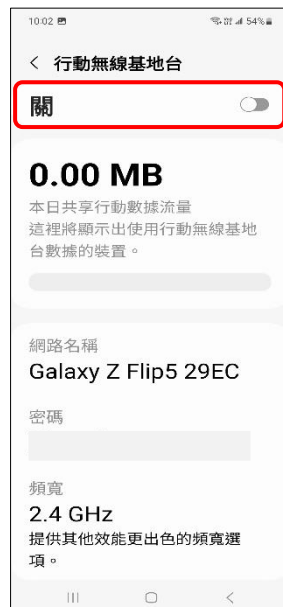
5.行動無線基地台→開