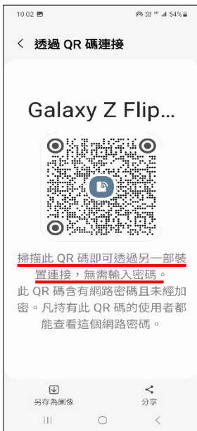
7.掃描 QR 碼即可連接