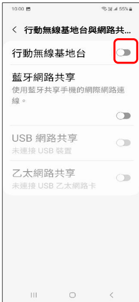
4.行動無線基地台→開啟 個人熱線 QR 分享